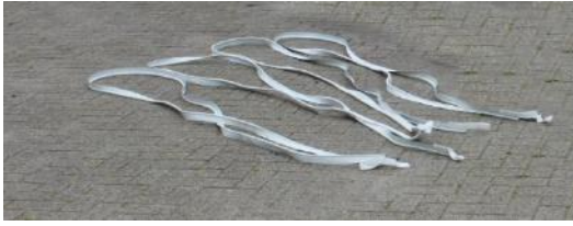
12.Tendon / Pees | 5000 mm | 4 st