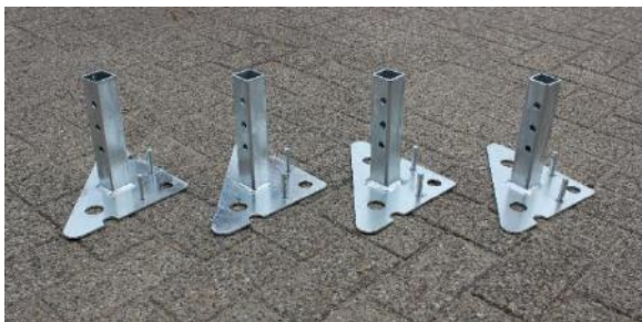
11.Foot base / Voet | 4 st