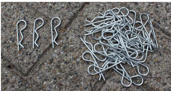
16.Hook / Slagpen | 28 st