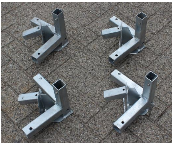
8. 4-way connector / 4-weg verbindingsstuk | 4 st