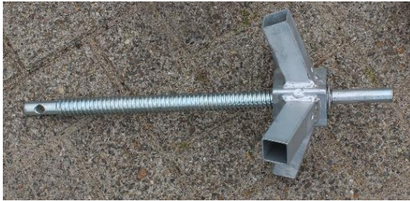
9.4-weg connector diagonal tube/4 weg verbindingsstuk diagonale buis | 1st