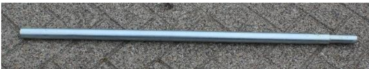
4. NOK tube / NOK buis | 1360 mm Ø32mm | 1 st