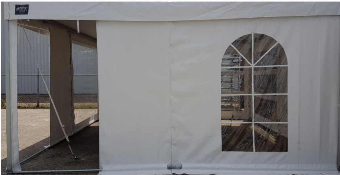
18.Side walls from the middle to be divided over the rope connection or zippers / Zijwanden vanuit het midden deelbaar via touwverbinding of ritsen | 5000 x 2300 mm | 4st