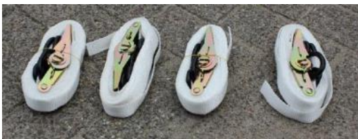
14.Strap / Spanband | 4 st