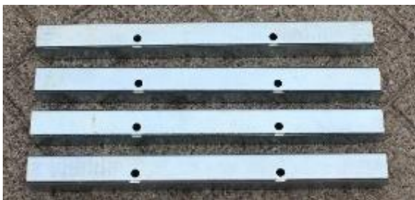
7. Connector tube Left and Right / Verbindingsstuk ligger Links en Rechts | 40 x 40 x 500 mm | 4 st