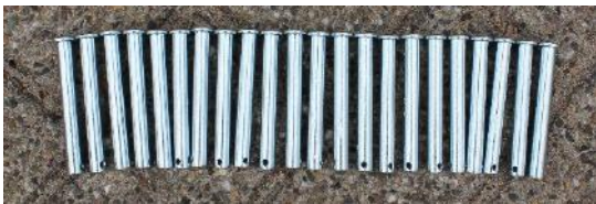
15.Screw / Pen | 20 st