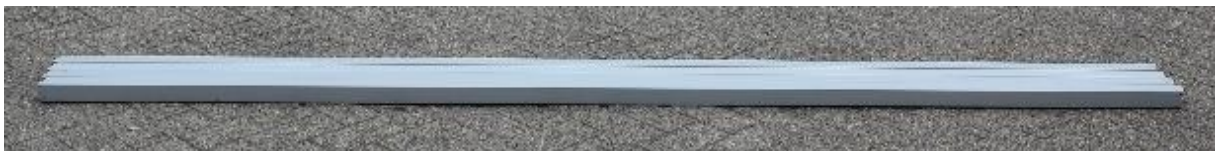
3. Diagonal Tube / Diagonale buis | 45 x 45 x 3536 mm | 4 st