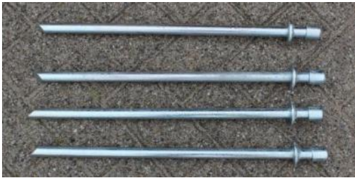
13.Big Peg / Haring | 550mm Ø20mm | 4 st