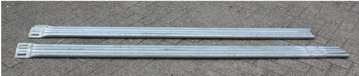
6. Base frame tube / Grondframe buis | 2500 mm Ø32mm | 8 st