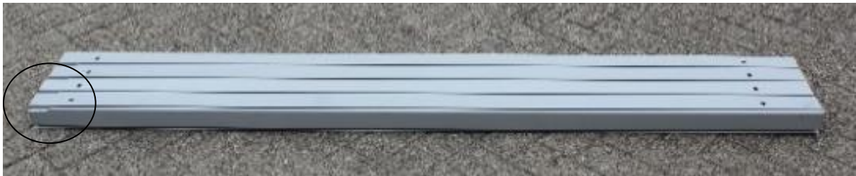
1. Tube Left / Ligger Links | 64.5 x 64.5 x 2425 mm | 4 st