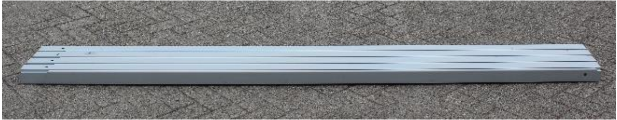
5. Leg Tube / Poot buis | 65 x 65 x 2450 mm | 4 st