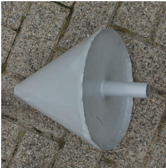
10.Roof top / toppunt dak | 1 st