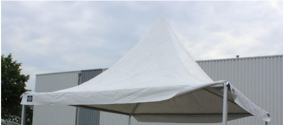
17.Roof / Dak | 1 st